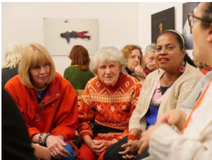
Deelnemers masterclass in gesprek

Na het zien van de expositie gingen mensen in gesprek over werken die hen geraakt hadden. Zo bleek dat ook dat kunstwerken bij verschillende deelnemers iets anders oproepen. De vraag wordt ook gesteld wat de bewoners van de instelling er zelf aan hebben. Na afloop van het verblijf worden alle bewoners voor de eindpresentatie uitgenodigd. Iedereen die zin heeft mag komen en meestal zijn mensen heel trots dat ze mee hebben gedaan.